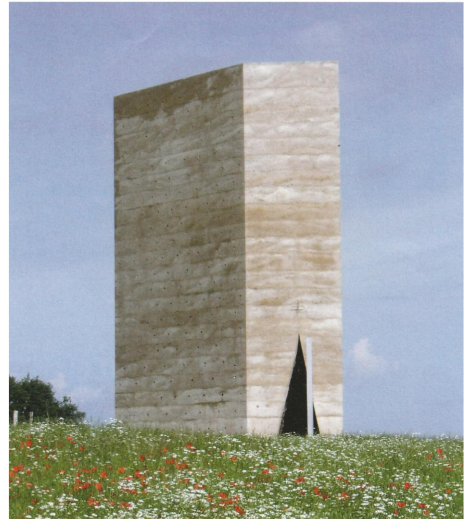
Die Kapelle von Osten gesehen im Morgenlicht