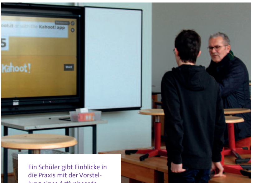
Ein Schüler gibt Einblicke in die Praxis mit der Vorstellung eines Activeboards.