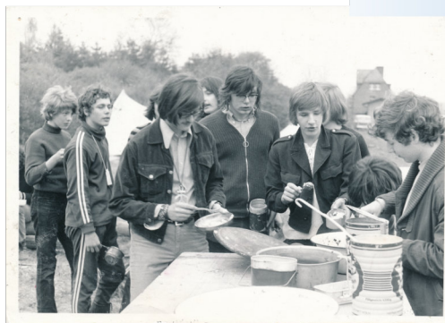
Pfingstzeltlager der KSJ-Gruppe St. Gereon 1972