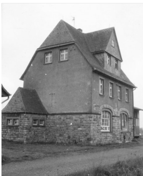
Der Bahnhof im Mai 1971